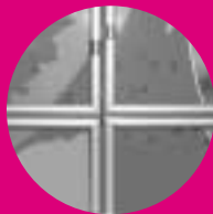
Marcos de aluminio