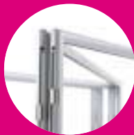
Fuertes bisagras patentadas