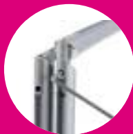
Cambia la imagen facilmente usando una llave allen