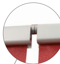
Conector magnético Expand®